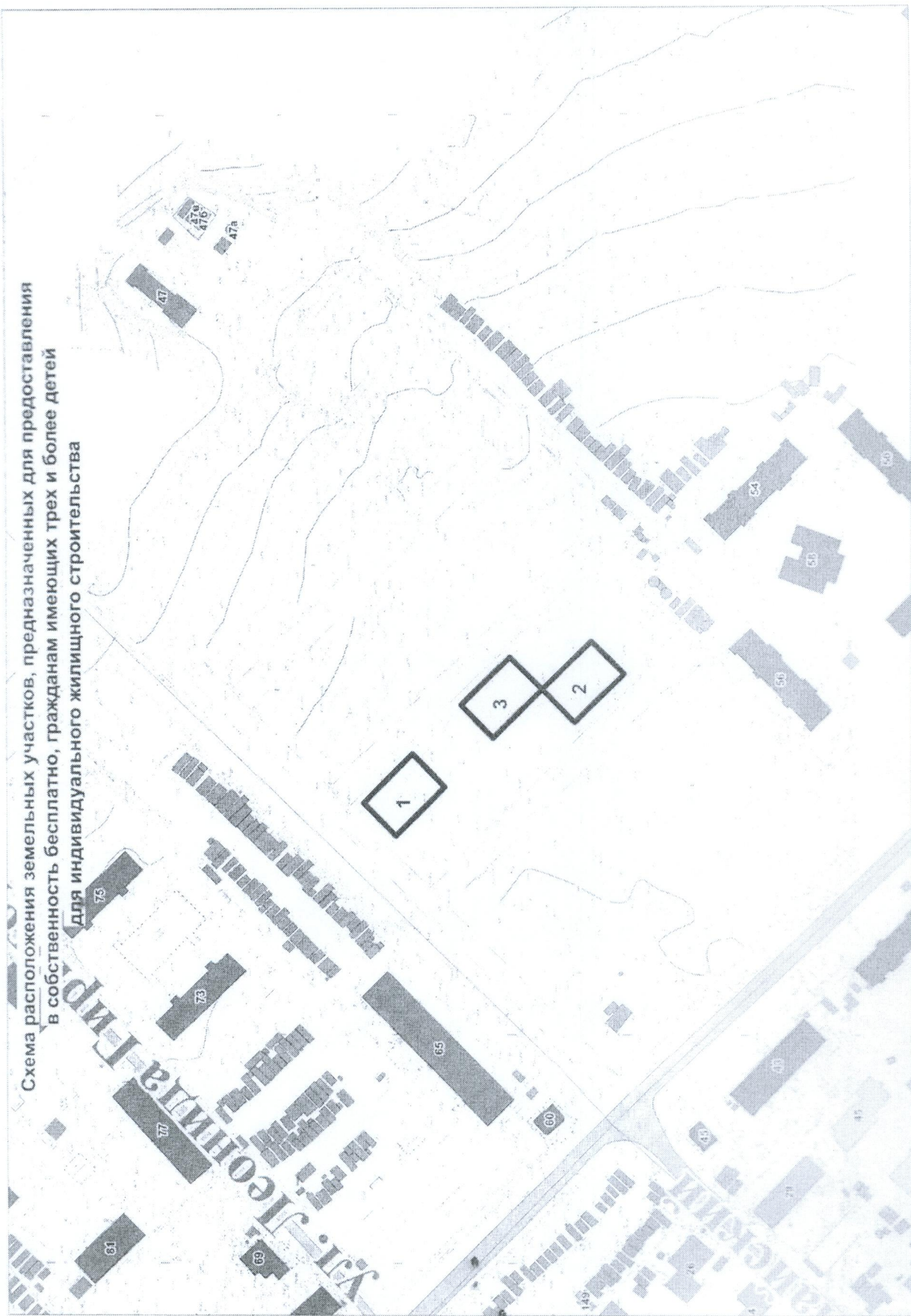
Схема расположения земельных участков, предназначенных для предоставления в собственность бесплатно, гражданам имеющих трех и более детей для индивидуального жилищного строительства