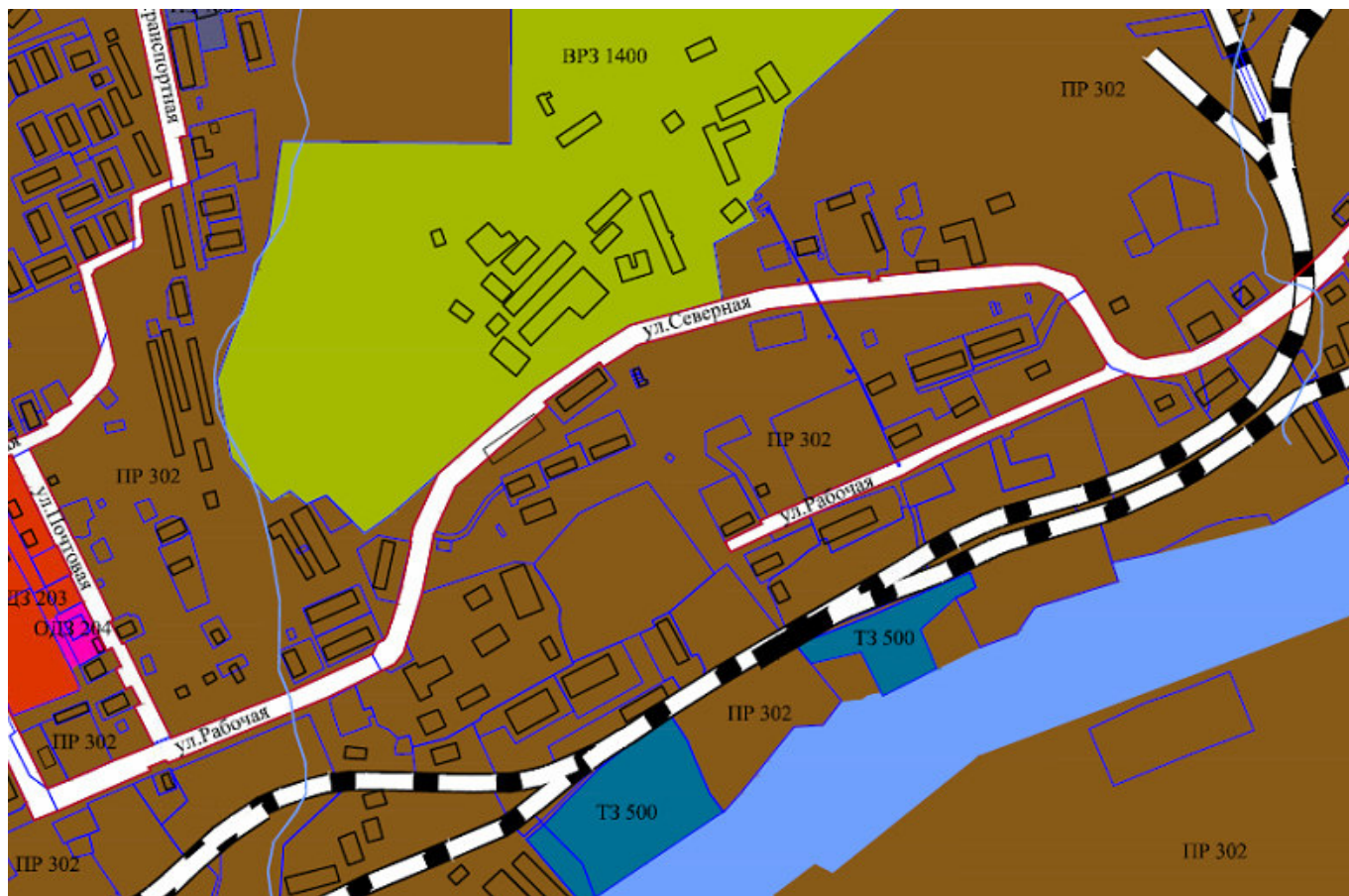
Рис.2 Фрагмент карты градостроительного зонирования

Фрагмент карты градостроительного зонирования г. Лабитнанги представлен на рисунке 2.