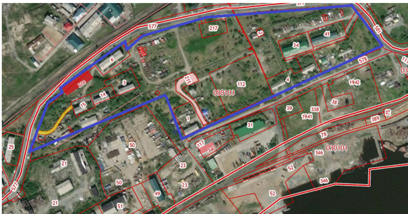
Рис.1 Местоположение проектируемой территории

Согласно топографической основе, территория проектирования обеспечена централизованными системами, теплоснабжения, электроснабжения и автономными системами водоотведения.